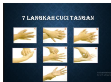
Gambar 2. Langkah-langkah mencuci tangan

Selain dengan menggunakan teknik mencuci tangan yang di anjurkan oleh WHO, kita juga dapat menggunakan teknik mencuci tangan yang dianjurkan oleh Departemen Kesehatan Republik Indonesia.