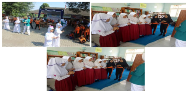
Gambar 4. Praktek Cara Cuci Tangan Yang Benar