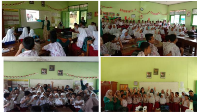
Gambar 3. Sosialisasi Cara Cuci Tangan Yang Baik Dan Benar