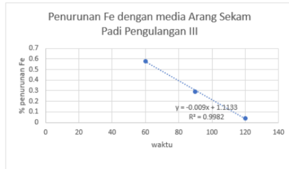
Grafik 3. Penurunan Fe dengan media arang sekam padi pengulangan III

Berdasarkan tabel di atas hasil R^2 adalah 0,9956 mendekati satu, dapat disimpulkan pada pengulangan 2 linier regresi.