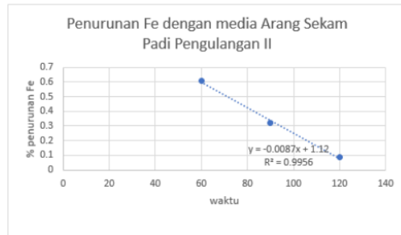
Grafik 2. Penurunan Fe dengan media arang sekam padi pengulangan II

Berdasarkan tabel di atas hasil R^2 adalah 0,9974 mendekati satu, dapat disimpulkan pada pengulangan 1 linier regresi.