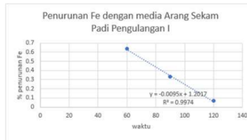
Grafik 1. Penurunan Fe dengan media arang sekam padi pengulangan I