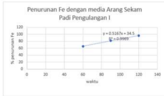
Grafik 4. Penurunan Fe dengan media arang sekam padi pengulangan I

Berdasarkan tabel di atas hasil R2 adalah 0,9969 mendekati satu, dapat disimpulkan pada pengulangan I linier regresi.