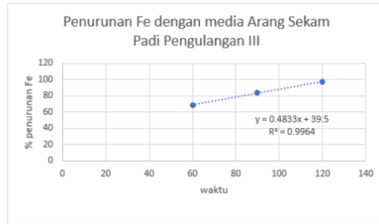
Grafik 6 Penurunan Fe dengan media arang sekam padi pengulangan III

Berdasarkan tabel di atas hasil R2 adalah 0,9983 mendekati satu, dapat disimpulkan pada pengulangan 2 linier regresi